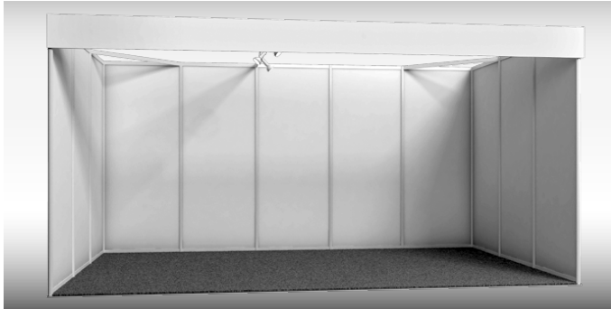
Beispiel-Abbildung: 15 m² Reihenstand | Example illustration: 15 m² row stand